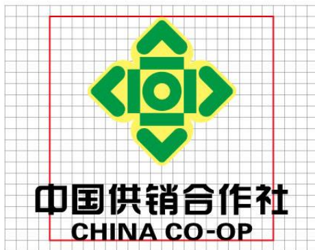
调整图形与汉字、英文名称的比例