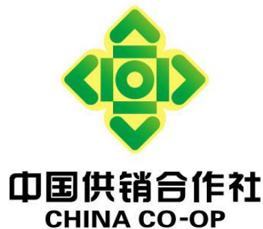
调整图形颜色 完善后的标识